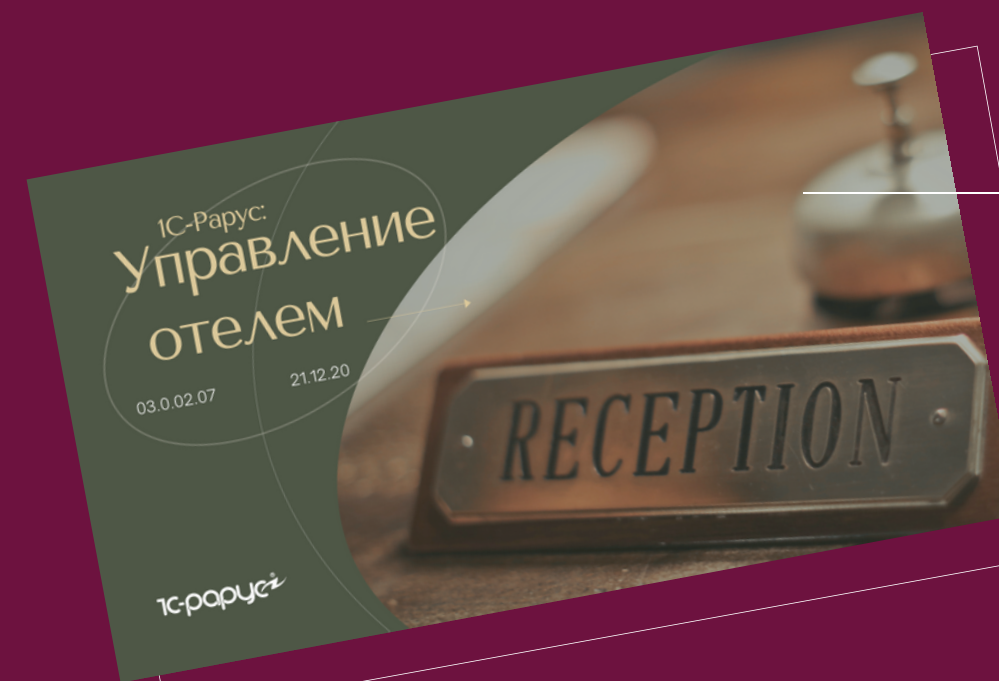
1С-Рарус: Управление отелем