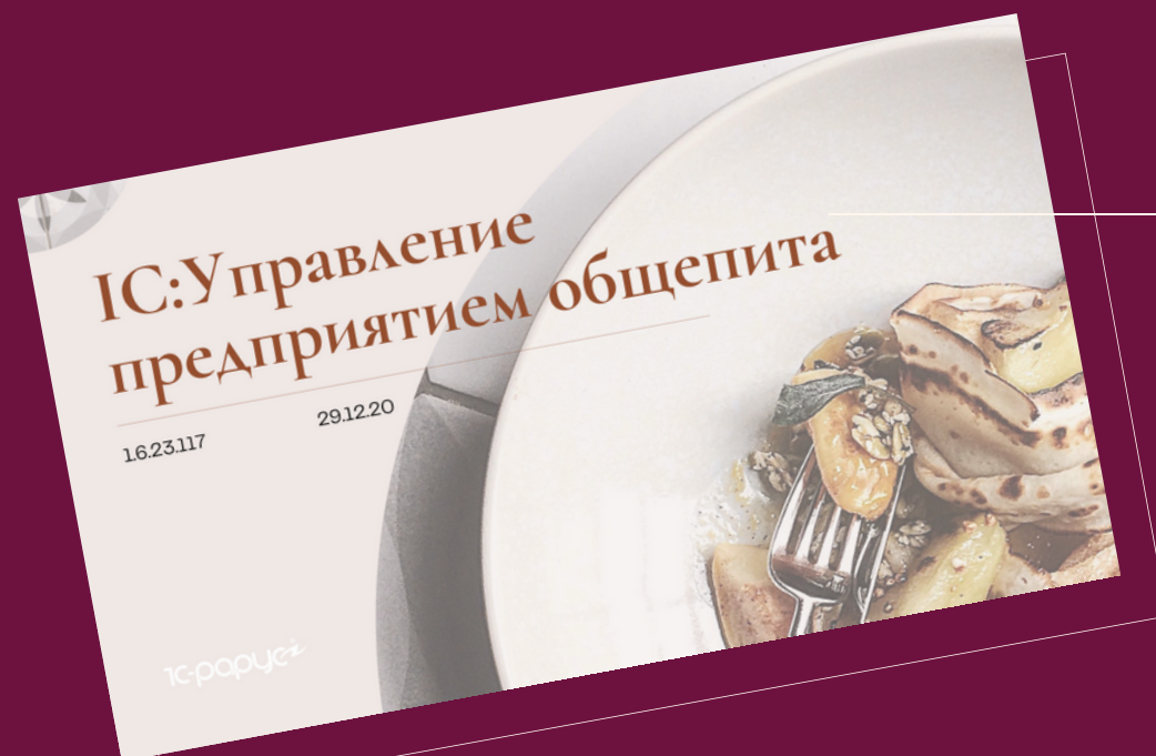
1С:Управление предприятием общепита