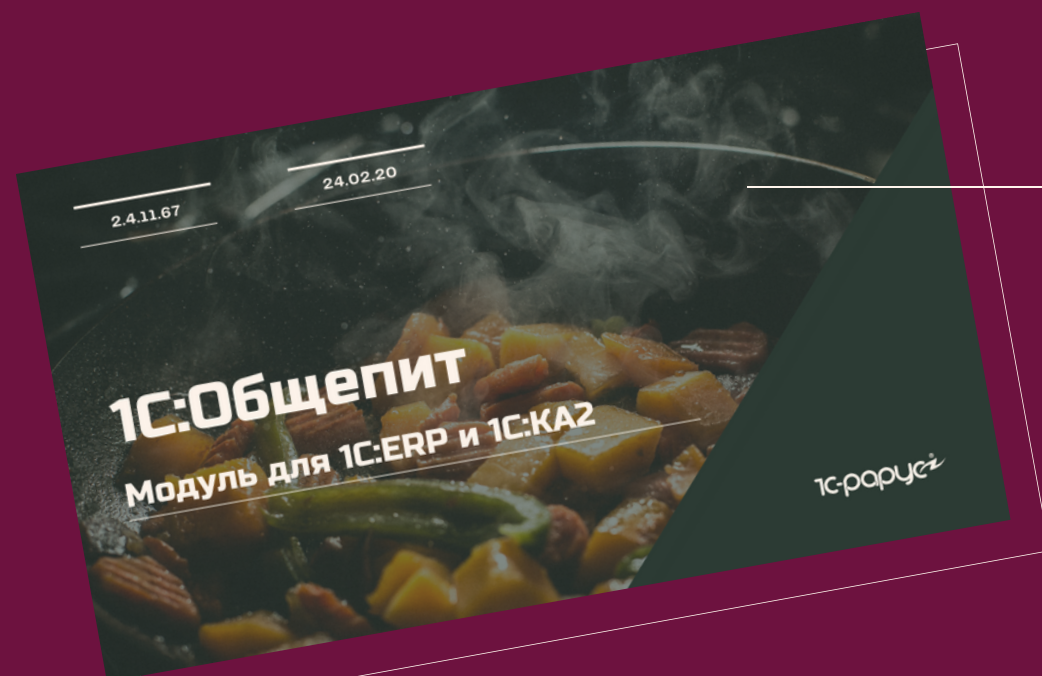
1С:Общепит. Модуль для 1С:ERP и 1С:КА2