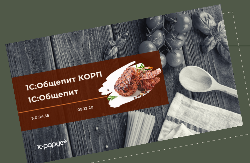
1С:Общепит КОРП, 1С:Общепит