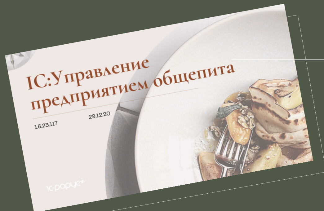
1С:Управление предприятием общепита