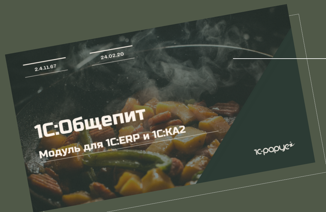
1С:Общепит. Модуль для 1С:ERP и 1С:КА2